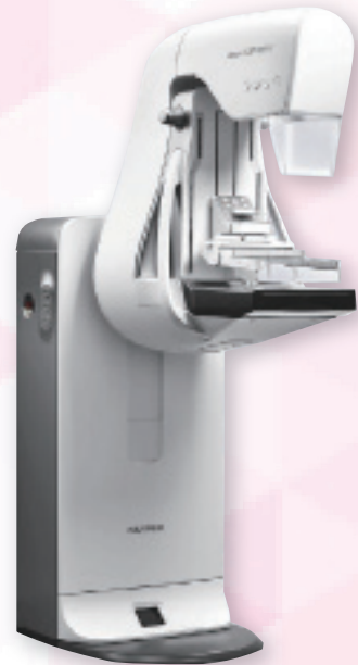
AMULET SOPHINITY / 富士フィルム