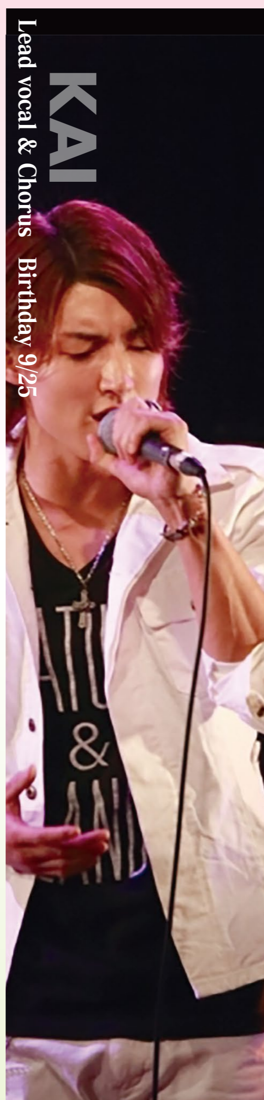
Lead vocal & Chorus Birthday 9/25

歌手になりたいという夢を 追い、音楽専門学校に進 む。さまざまなジャンルの 音楽を学びヴォーカリスト として実力をつけていく。 2017年にSOLZICKのメ ンバーとなる。