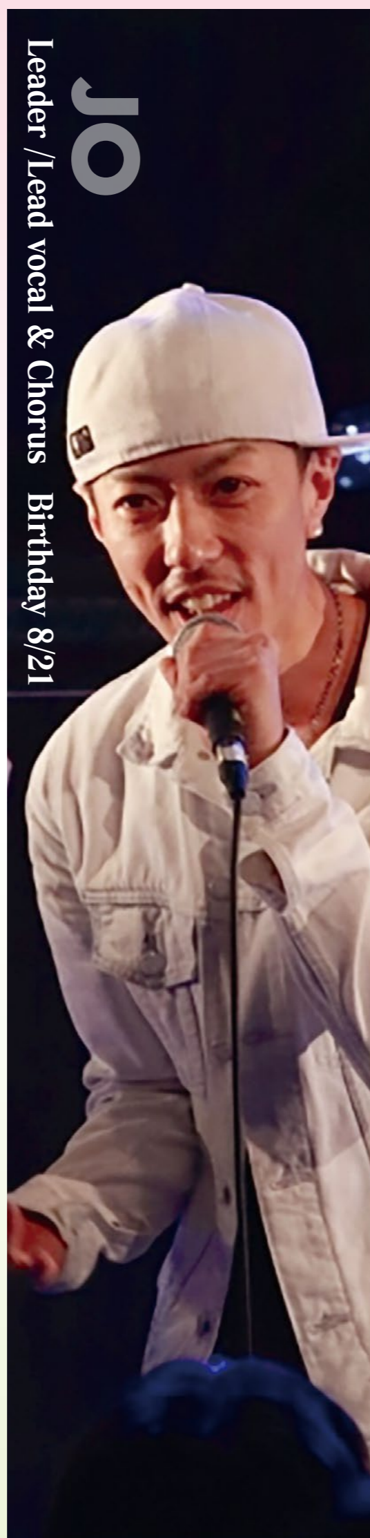
Leader/Lead vocal & Chorus Birthday 8/21

Oh, Pretty woman Stand by me Twist and shout いとしのエリー 世界にひとつだけの花 September 花束のかわりにメロディーを Sugar baby love Story ..... Please enjoy !!