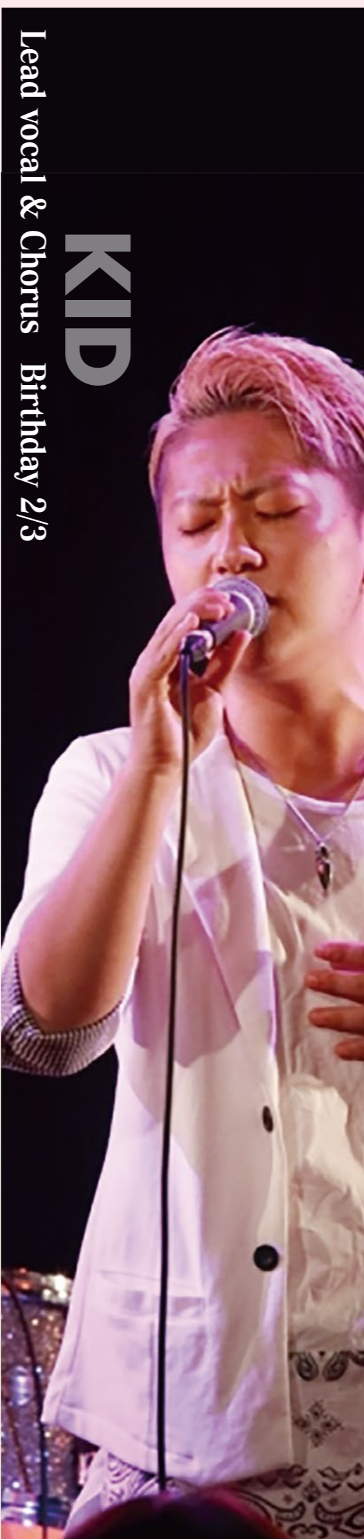
Lead vocal & Chorus Birthday 2/3

音楽専門学校卒業後プロ アカペラグループに加入 し、関西で約2年間活動。 その後R&Bに興味を持ち、 東京のクラブでソロ活動 開始。 2003年にSOLZICKの 前身グループVoix Douce を結成。SOLZICK楽曲 の作詞・作曲・アレンジの 大半を手がける。