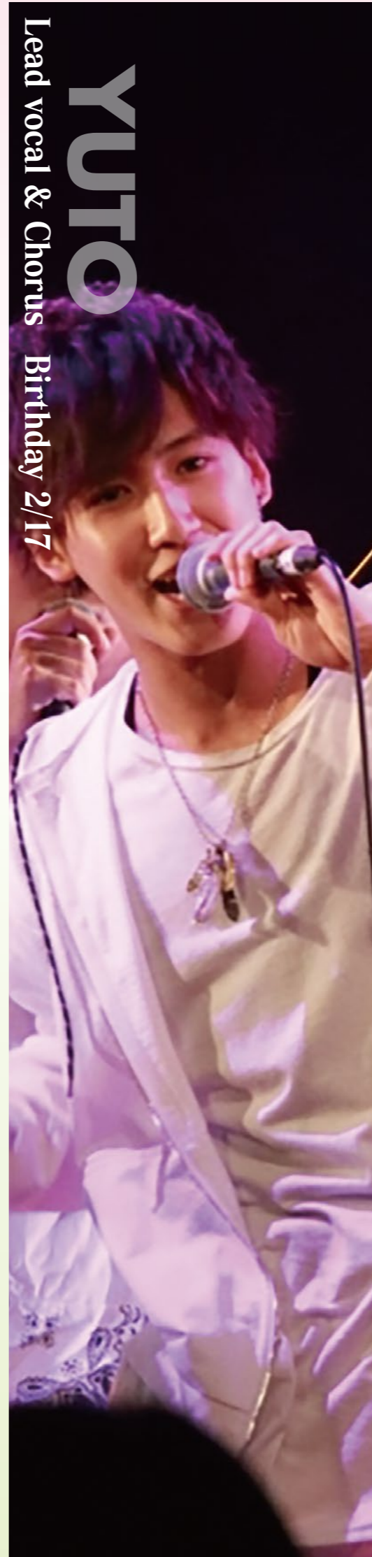
Lead vocal & Chorus Birthday 2/17

夢を抱き音楽専門学校に 入学。アーティスト学科で ヴォーカルと作詞を学びス キルを高める。 SOLZICKと出会いアカペ ラの奥深さを知り、2017 年にSOLZICKのメンバー となる。