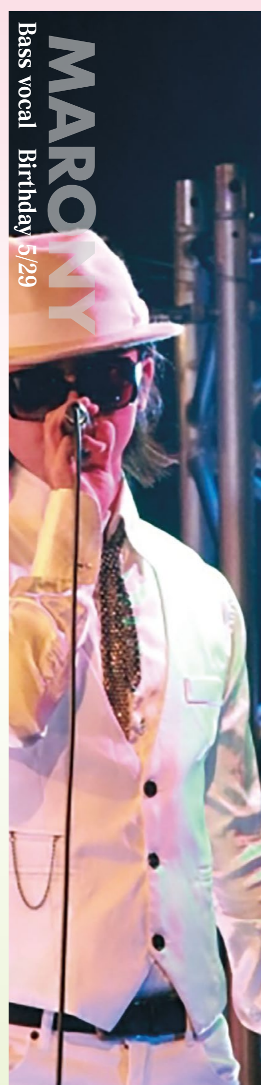
Bass vocal Birthday 6/29

プロのミュージシャンめざ し音楽専門学校に入学。 ヴォーカルのみならず現 在は、音楽活動の幅を広げ るためギターやキーボード を学んでいる。 2018年にSOLZICKのメ ンバーとなる。